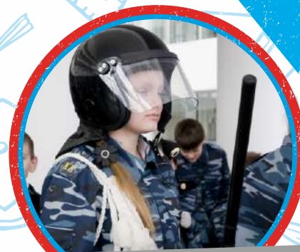
ЮНЫЕ ДРУЗЬЯ ПОЛИЦИИ