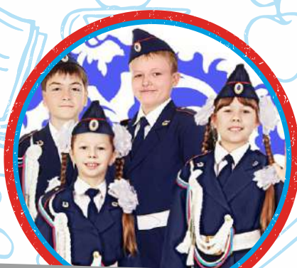
ЮНЫЕ ИНСПЕКТОРА ДВИЖЕНИЯ